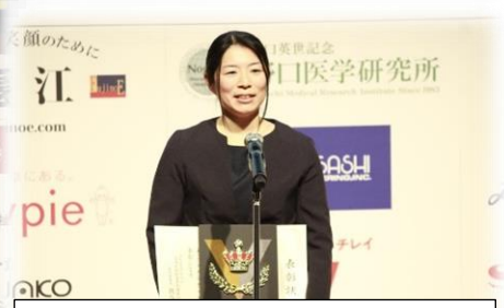
表彰式的最優秀賞受賞スピーチ