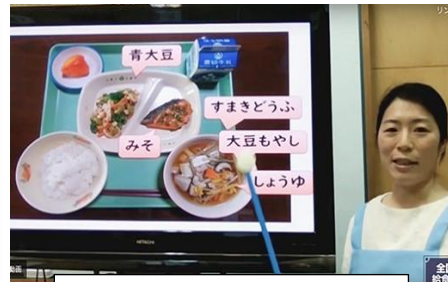
応募した食育授業(動画)